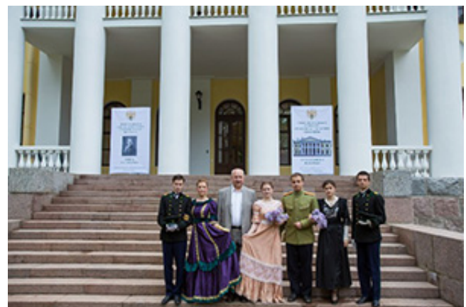
Участники ВИК Наш Политех и