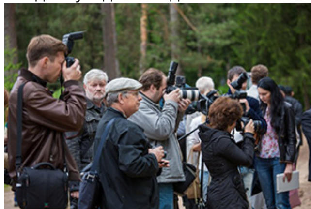
Пресса на церемонии открытия