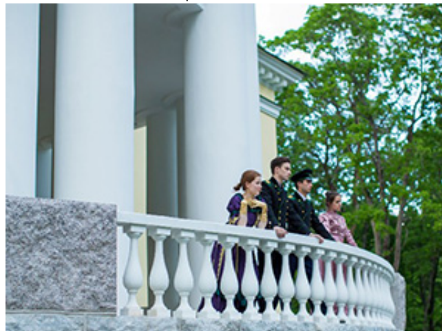
Участники театрализованного представления на открытии усадьбы