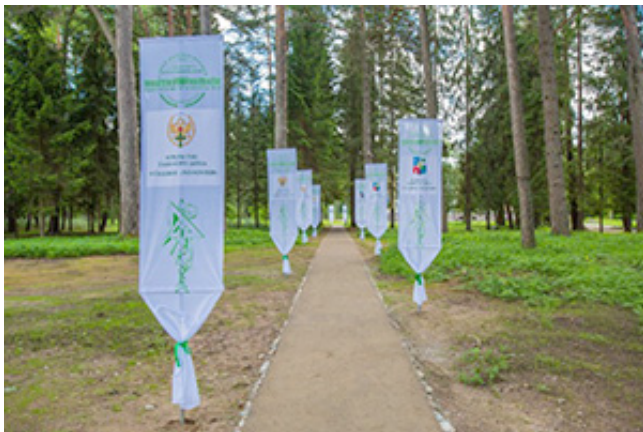
Штандарты СПбГПУ вдоль дорожки к усадебному дому