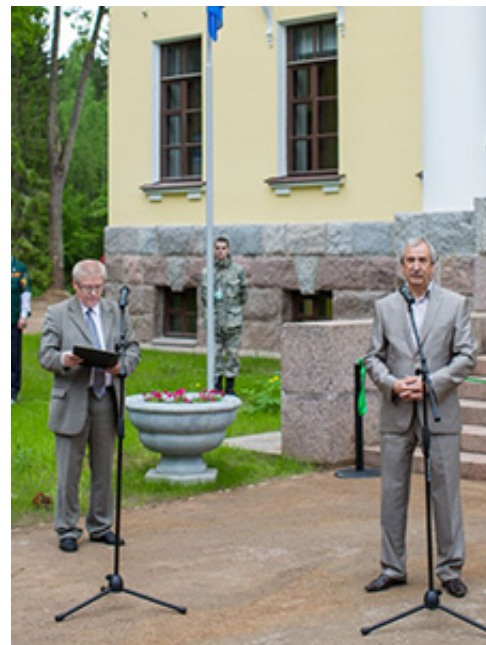
Председатель Комитета по культуре Псковской области Александр Голышев