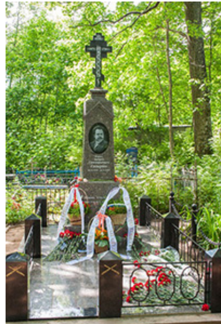
Могила кн. А.Г. Гагарина в Бельском Устье