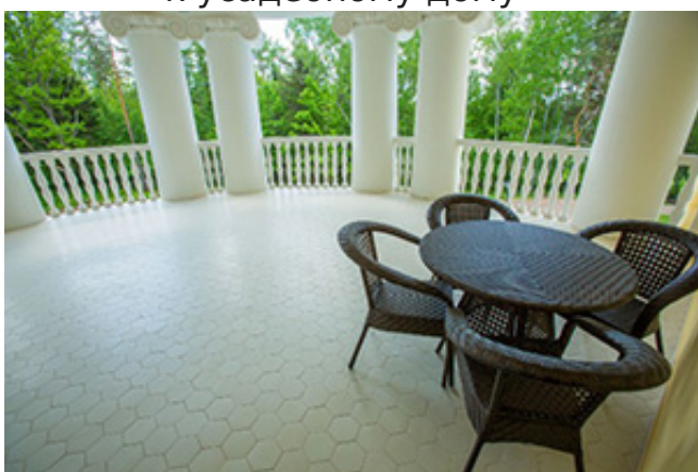
Вид на полуротонду Холомки