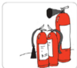
Огнетушители (Требования по количеству и виду в приложениях 1,2 Правил противопожарного режима в РФ)

Для общественных зданий с защищаемой площадью до 800 кв.метров для тушения пожара класса А требуется: 4 пенных или водных огнетушителя вместимостью 10 литров, 8 порошковых огнетушителей вместимостью 2 литра, либо 4 порошковых огнетушителя вместимостью 5 литров, либо 2 порошковых огнетушителя вместимостью 10 литров, либо 4 углекислотных огнетушителя вместимостью 5 литров.