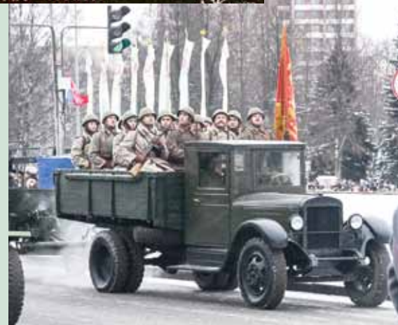
Политехники на праздничном параде