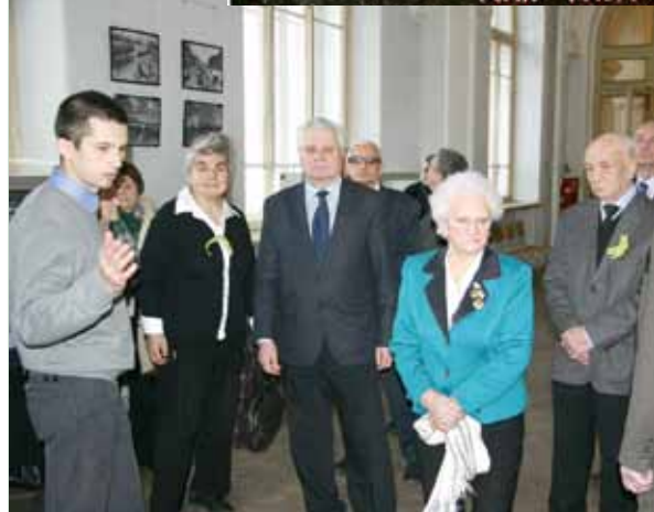
На выставке «Ленинград сквозь блокаду»

В ЛЕНИНГРАДЕ НЕТ ГРАНИ МЕЖДУ ФРОНТОМ И ТЫЛОМ ВСЕ ЖИВУТ ОДНОЙ МЫСЛЮ, ОДНИМ ДУХОМ – ВСЕ СДЕЛАЮТ ДЛЯ РАЗГРОМА ВРАГА.