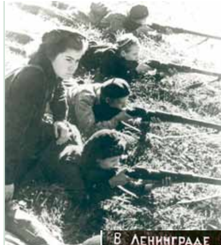
На выставке «Ленинград сквозь блокаду»