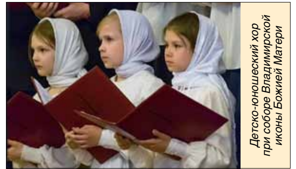
Детско-юношеский хор при соборе Владимирской иконы Божией Матери