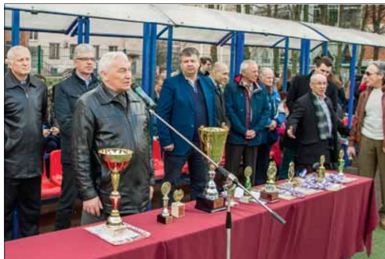
Почетные гости Олимпиады перед вручением наград победителям соревнований