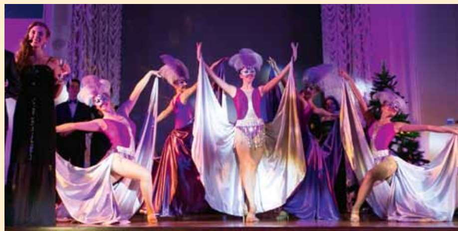
Ни одного оттенка серого! – под таким девизом делаются все мюзиклы. Этот жанр покоряет зрителей не только пением и танцами, но и полифонией ярких костюмов и декора. О том, как создавался мюзикл ко дню рождения Политеха, – на стр. 6