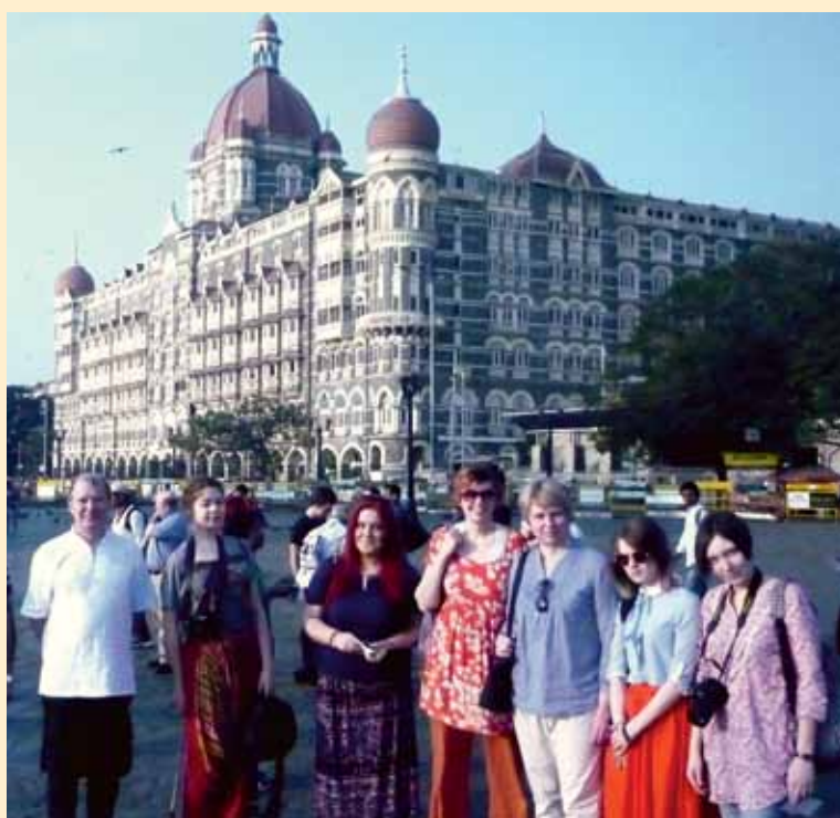
Изучение особенностей страны махараджей и заклинателей змей очень понравилось всем членам делегации СПбПУ

Все участники получили сертификаты об окончании Международной политехнической зимней школы по ядерной энергетике. Радует то, что иностранные гости СПбПУ обещали вернуться за новыми знаниями, впечатлениями и опытом.