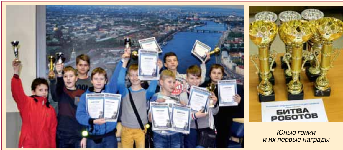
Юные гении и их первые награды