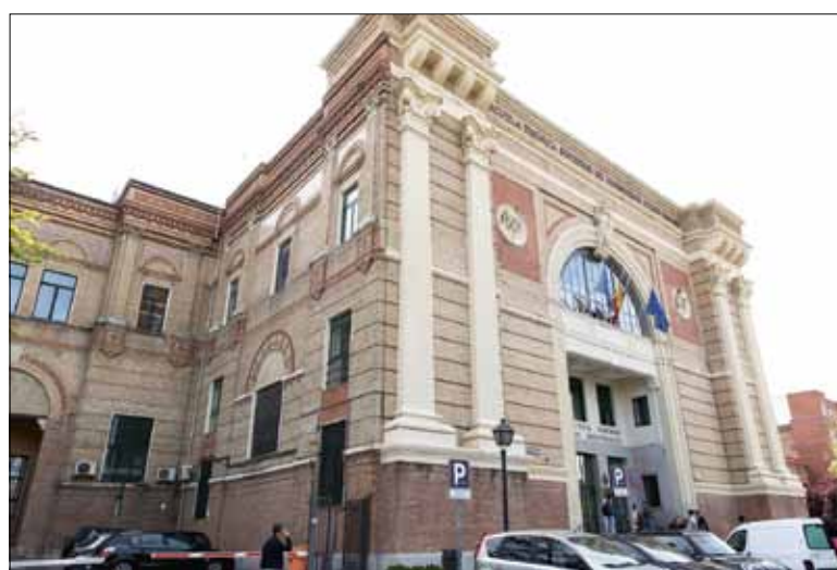
Мадридский политехнический университет

Сейчас в отношениях Политеха с испанскими вузами существует дисбаланс – исходящая акаде-