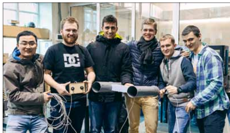
Одна из команд представила портативную подложку для автономной съемки под водой