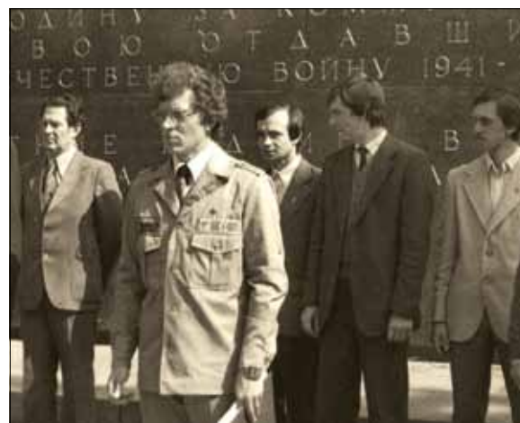
1982 г. Митинг у Памятника погибшим политехникам перед отъездом зонального ССО вузов города на Саяно-Шушенскую ГЭС