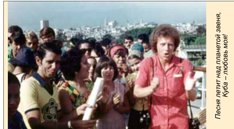
Песня летит над планетой звеня, Куба – любовь моя!

...И вот наконец остров Свободы. Фестиваль продолжался неделю, и все эти дни страна не работала. К нам на корабль приходил Рауль Кастро, а вот Фиделя не видели. В подарок кубинцам мы привезли несколько новеньких Икарусов с