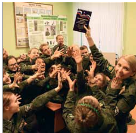
Воинский устав – наша путеводная звезда!

После перерыва мы шустро вернулись на места. Нас проинструктировали, разделив на взводы и отделения. Затем поступил приказ проследовать на построение.