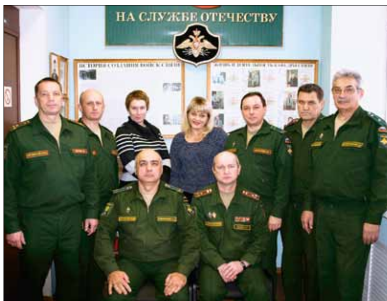
Преподаватели факультета военного обучения – настоящие патриоты, потому что каждый из них, как написано на плакате, находится «На службе Отечеству»