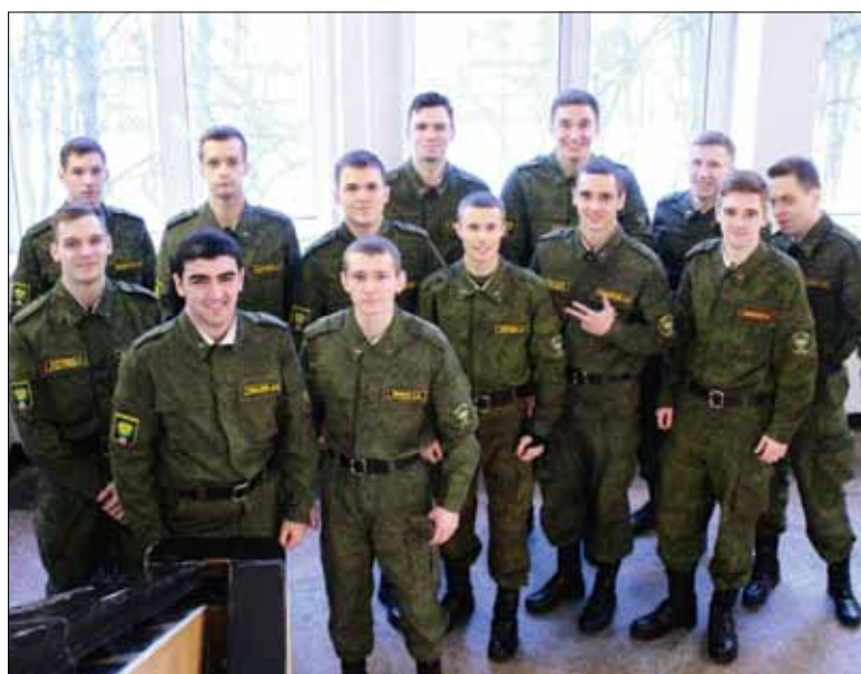
Мы, будущие офицеры, знаем: человек в военной форме всегда должен быть в форме. А это значит – быть защитником не только на поле боя, но и в обычной жизни: брать на себя самое трудное, быть надежной опорой семьи... И всегда оставаться благородным рыцарем