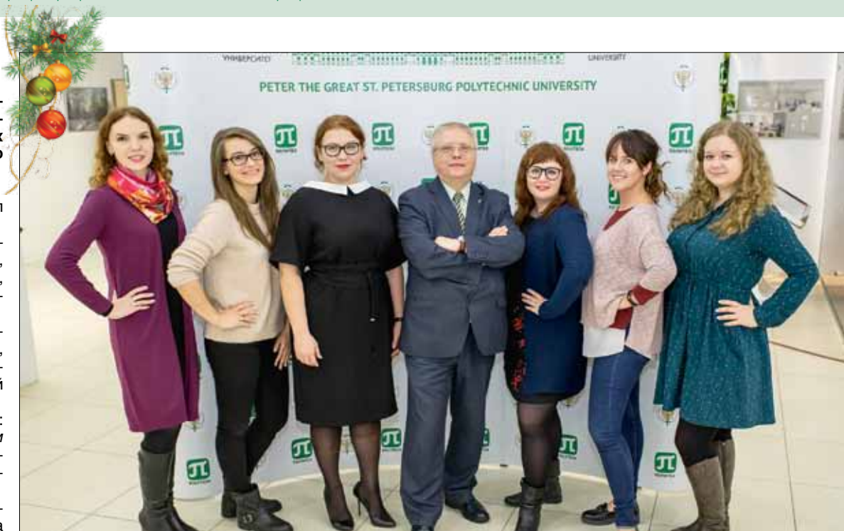
Научно-популярный сайт «Индикатор» составил рейтинг, в котором оценил эффективность PR-деятельности пресс-служб университетов – участников Проекта 5-100 за первое полугодие 2017 г. Согласно собранным данным, Политех вошел в пятерку лучших вузов, набрав 27 баллов из 39 возможных.