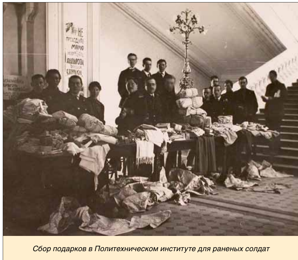
Сбор подарков в Политехническом институте для раненых солдат

Стоит отметить, что 65-й пехотный Московский полк в то время действительно вел напряженные бои на территории Латвии.