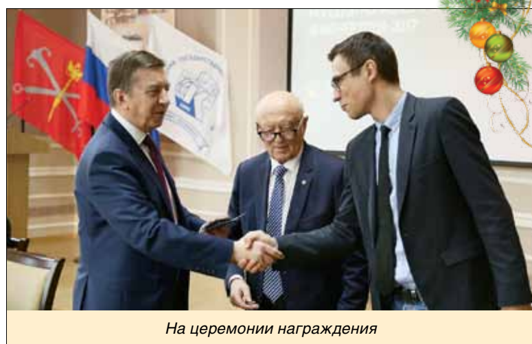
На церемонии награждения

Конкурс проводится Российским научно-техническим обществом судостроителей имени академика А.Н. Крылова. В этом году заявки подали около 100 человек более чем из 30 судостроительных предприятий Москвы, Санкт-Петербурга, Северодвинска, Чебоксар, Владивостока и др. городов. Все представленные проекты отличались актуальностью и новизной при решении технических задач отрасли. Тем веселее призна-