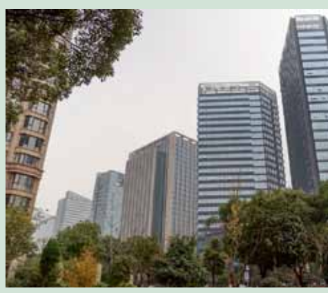
Необычный ракурс: в одной из этих высоток располагается компания ENV