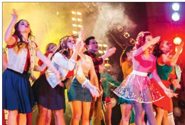
Финальный танец всех участников сезона

На праздничном вечере вступающие встретили невероят-