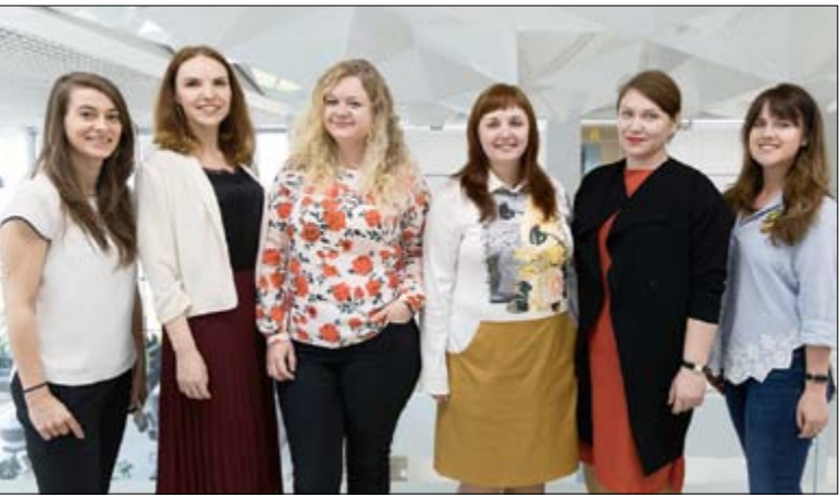
На фото: команда Медиа-центра и Сектора научных коммуникаций Политехнического университета

ство – мы создаем промо-ролики, видео новости о жизни Политеха, сюжеты и интервью с учеными и интересными людьми. Распространение информации о наших научных достижениях, международном сотрудничестве и проектах, реализуемых совместно с органами власти и бизнес-структурами, тоже важная часть нашей работы.