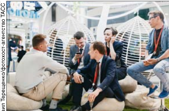
Петербургский международный экономический форум стал модным брендом Петербурга

спективы и позволяет укрепить позиции КАМАЗа как ведущего российского автопроизводителя.