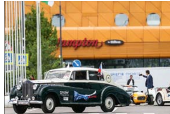
Когда-нибудь на смену старинным автомобилям, представленным в проекте «Ралли мира-2018», придут электрокары, в создании которых участвует и Политех.