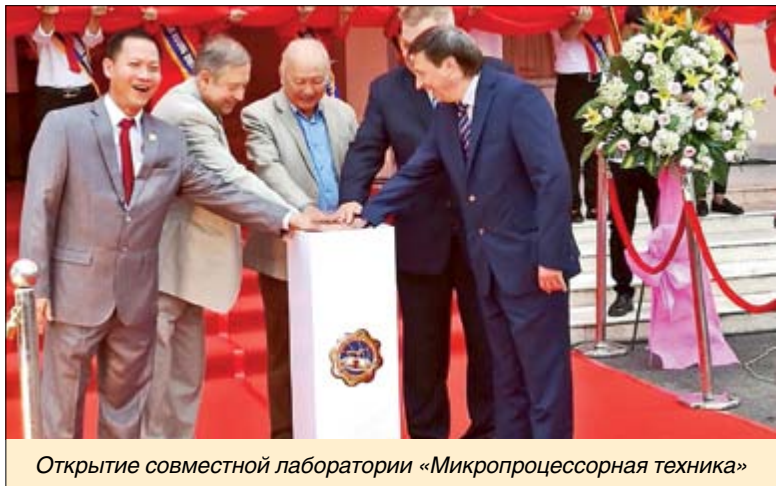
Открытие совместной лаборатории «Микропроцессорная техника»

Масштабный фестиваль «Дни российской культуры и науки» проходил две недели в г. Хошимине на базе вьетнамского университета Бинь Зьонг (БЗУ), с которым Политех уже более 10 лет связывают не только партнерские, но и дружеские отношения.