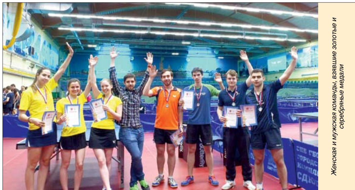
Женская и мужская команды, взявшие золотые и серебряные медали