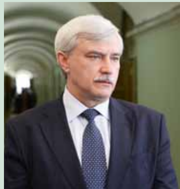
Губернатор Санкт-Петербурга Г.С. Полтавченко