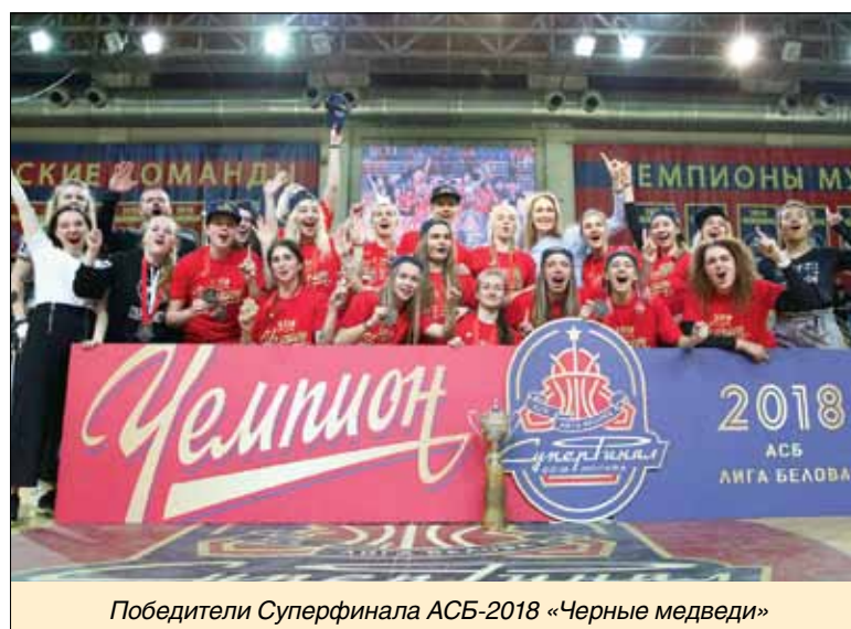
Победители Суперфинала АСБ-2018 «Черные медведи»

Во всероссийских чемпионатах АСБ девушки в 2016 г. взяли бронзу, в следующем сезоне заняли второе место. И заветное звание победителей Суперфинала АСБ смогли получить только сей-