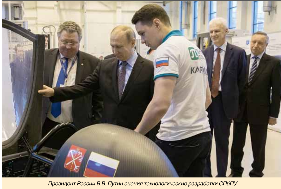
Президент России В.В. Путин оценил технологические разработки СПбПУ

Владимир Владимирович заверил, что государство и дальше будет поддерживать вузы, которые активно занимаются исследованиями и разработками, обновлять их технологическую и приборную базу, содействовать привлечению к совместной работе соотечественников и ведущих ученых из-за рубежа. А также пообещал поручить новому правительству разработать совместно с субъектами федерации дополнительную программу строительства общежитий, современных комфортных кампусов.