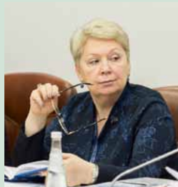
Министр образования и науки О.Ю. Васильева