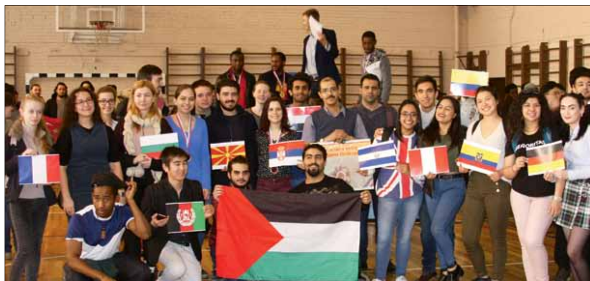
Как прекрасен этот мир в многоцветье флагов!

Кубок за активность и массовость был вручен команде Африки, а представители Монголии по-