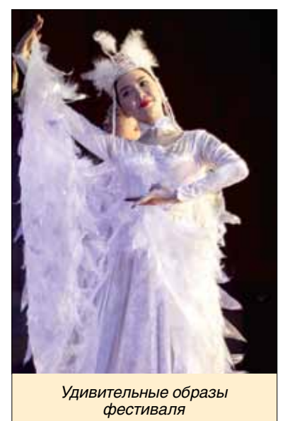
Удивительные образы фестиваля

фортепиано и рассказали об известных людях России и Австрии. Концерт завершила ВШМОП с русской пляской под знаменитую «Калинку».