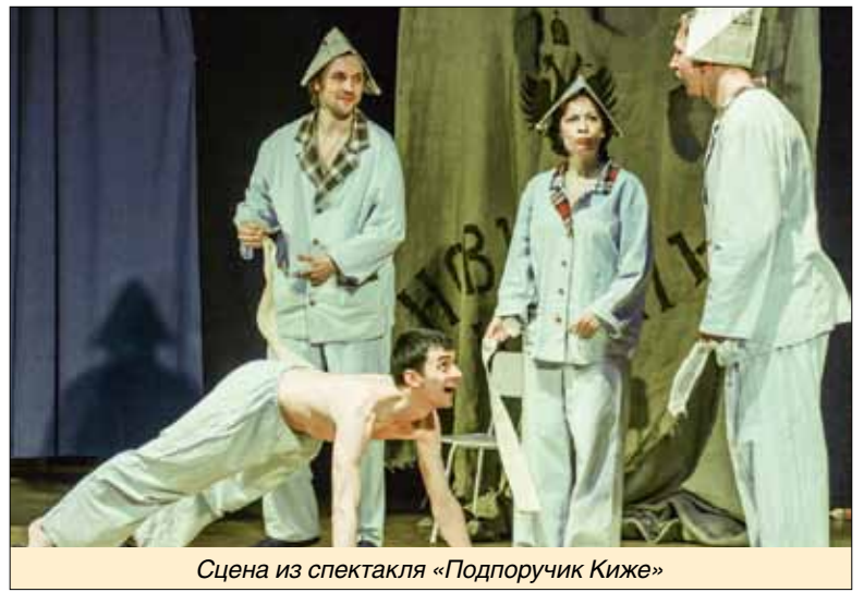
Сцена из спектакля «Подпоручик Киж»

«Глагол» привез на фестиваль спектакль «Подпоручик Киж», поставленный в жанре литературного театра по рассказу Юрия Тынянова. Рассказ был написан на основе абсурдного случая, реально произошедшего во вре-