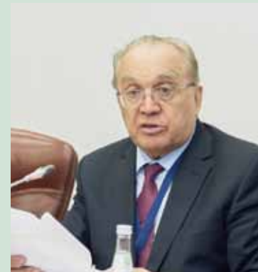
Президент РСР, ректор МГУ В.А. Садовничий