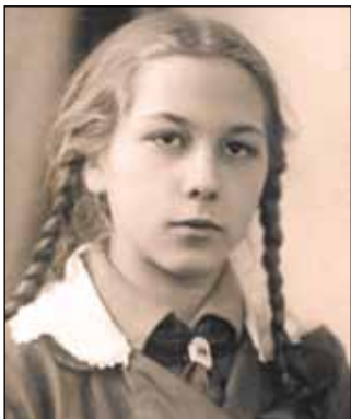
Фото довоенных лет