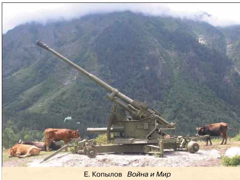
Е. Копылов Война и Мир