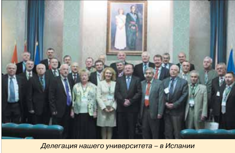
Делегация нашего университета – в Испании

Деловая программа визита была насыщенной. Члены делегации приняли активное участие в конференции на тему «Совре-