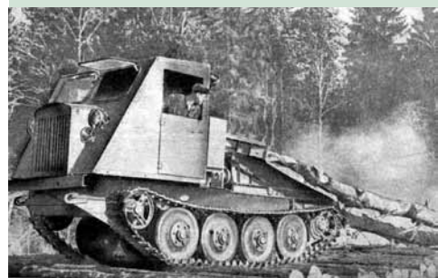
Трактор КТ-12 (Кировский трелевочный, 12-я модель) – послевоенная серийная машина с газогенераторной установкой – использовалась в период восстановления народного хозяйства в СССР. Разрабатывался при участии выпускников кафедры.