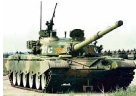
Основной танк Т-80 – первый и в нашей стране, и за рубежом танк с газотурбинным двигателем – состоит на вооружении в России и других странах и до сих пор считается одним из лучших в мире. Руководитель работ – зав. кафедрой 1946-49 гг. Ж.Я. Котин.

При вузе создан Автоцентр, поддерживающий связи с автопредприятиями и правительством нашего города.