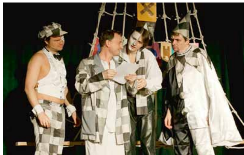
Вот он, многоЛИкий Хармс