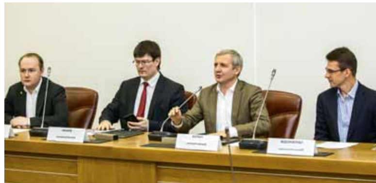
Участники подписания договора – члены жюри заключительного регионального этапа Всероссийского конкурса «IT-прорыв»

ОАО «Российская электроника» создано в 1997 г. Указом Президента РФ. С 2009 г. входит в состав ГК «Ростехнологии» и является одной из крупнейших его структур. В настоящее время «Росэлектроника» консолидирует потенциал 121 предприятия электронной отрасли, которые специализируются на разработке и производстве изделий электронной техники, материалов и оборудования для их изготовления, СВЧ-техники и полупроводниковых приборов; подсистем, комплексов и технических средств связи; а также автоматизированных и информационных систем.