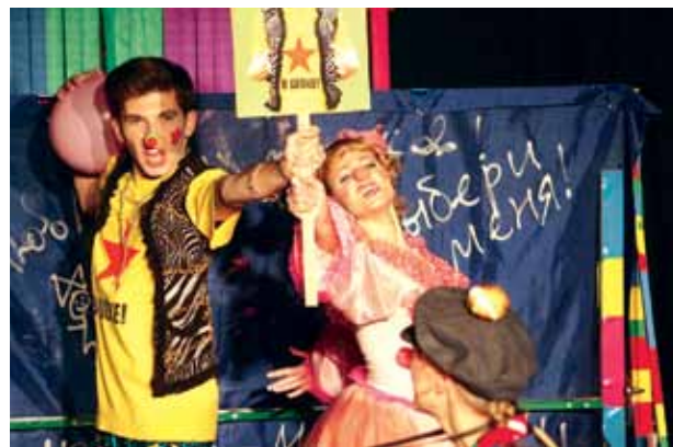
Фрагменты из спектаклей: «12,5 дураков» (театр «Глагол») и «Трехгрошевая опера» (театр ВТУЗа)