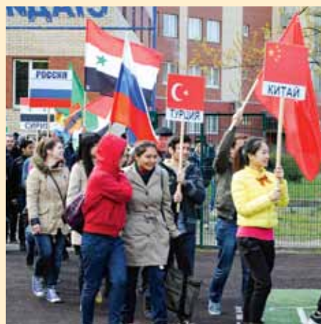
У нас проводятся даже свои Олимпийские игры, но и во Всемирных мы тоже принимали участие — там работали наши волонтеры