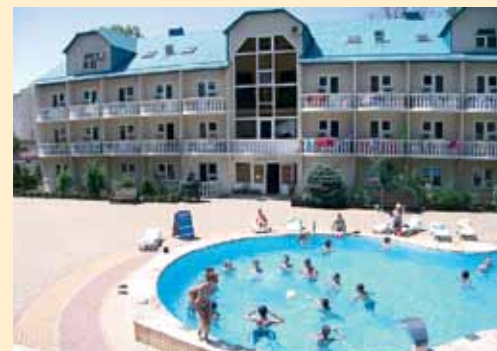
Наш Южный лагерь у самого синего моря