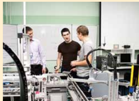
В лаборатории университета