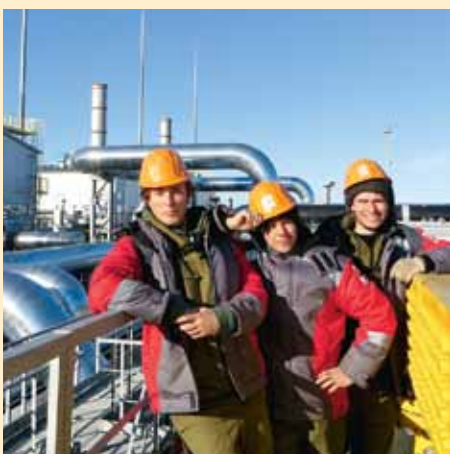
Стройотрядовское лето — в памяти многих поколений политехников