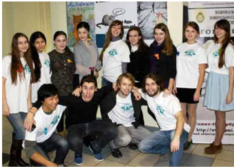
Покровский форум: хорошо быть вместе