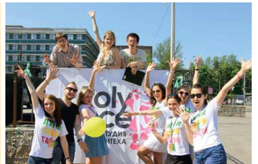
Танцуем все, танцуем всё!