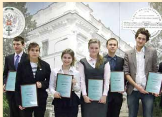
Дерзость научных проектов — залог успешного будущего!