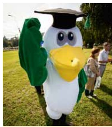
Пеликан – символ профсоюза студентов, символ заботы

Тот, кто привык быть в курсе всех событий или хочет сам научиться «выдавать» свежие новости, пусть смело направляется в редакцию нашего красочного