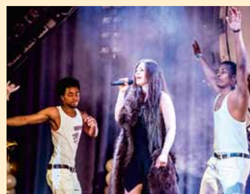
Ежегодно восходит новая «Звезда Политеха»