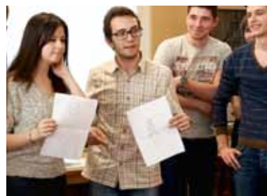
«Семья» – забудь про своё «я», теперь – только «мы»

Кстати, еще один приятный бонус международного кухонного, да и просто общежитского, сотрудничества – возможность научиться говорить на нескольких языках. Как-то, спасая ужин, я узнала, что в наших языках есть похожие слова: к примеру, испан-