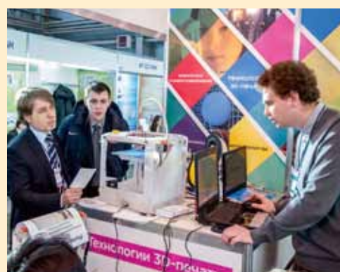
Презентация проекта «DIY 3D-принтер»