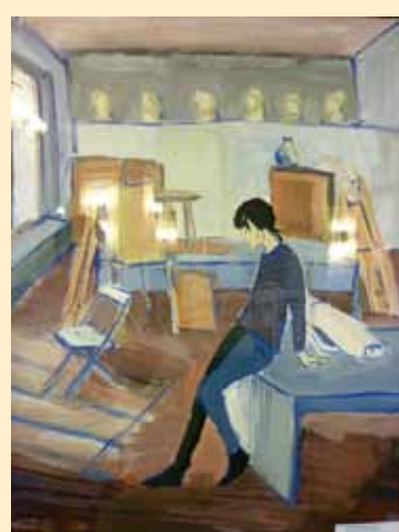
Программа Политехнической недели включала и выставку творческих работ студентов кафедры «Инженерная графика и дизайн», приуроченную к ее 20-летию. Церемонии открытия экспозиции посетила делегация японской компании GK Design Group Inc., с которой Политех подписал соглашение о сотрудничестве