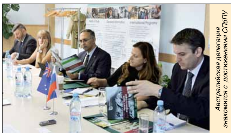
Австралийская делегация знакомится с достижениями СПбПУ

В рамках встречи обсуждались также вопросы, касающиеся стипендиальной программы «Глобальное образование», организа-