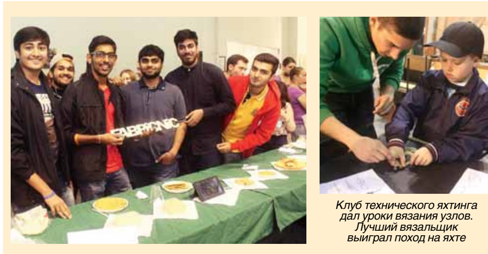
Клуб технического яхтинга дал уроки вязания узлов. Лучший вязальщик выиграл поход на яхте

21 мая в Политехническом прошел Фабпикник, который объединил сразу два ключевых события: день рождения Фаблаб Политех и ресторанный день. Несмотря на плохую погоду, на «пикник» собралось более 400 человек.