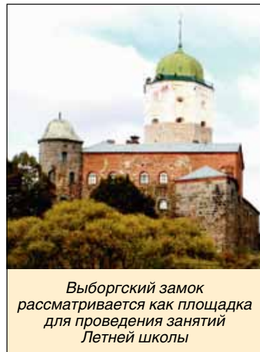
Выборгский замок рассматривается как площадка для проведения занятий Летней школы

Aalto University – государственный университет Финляндии, с 2010 г. собравший под одной крышей ведущие вузы страны: Технологический университет Хельсинки (основан в 1849 г.), Хельсинскую школу экономики (1904 г.) и Университет искусства и дизайна (1871 г.). Объединив инженеров, бизнесменов и дизайнеров, финны получили показательную модель скандинавского образования.