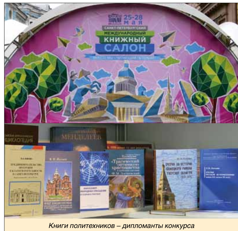
Книги политехников – дипломанты конкурса

По информации Медиа-центра и международных служб СПбПУ