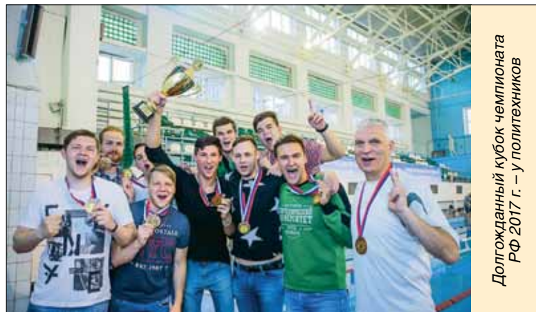
Долгожданный кубок чемпиона РФ 2017 г. – у политехников