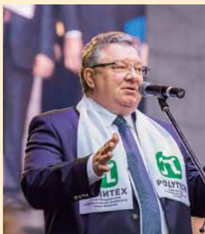
Ректор Политехнического университета Петра Великого Андрей Иванович Рудской