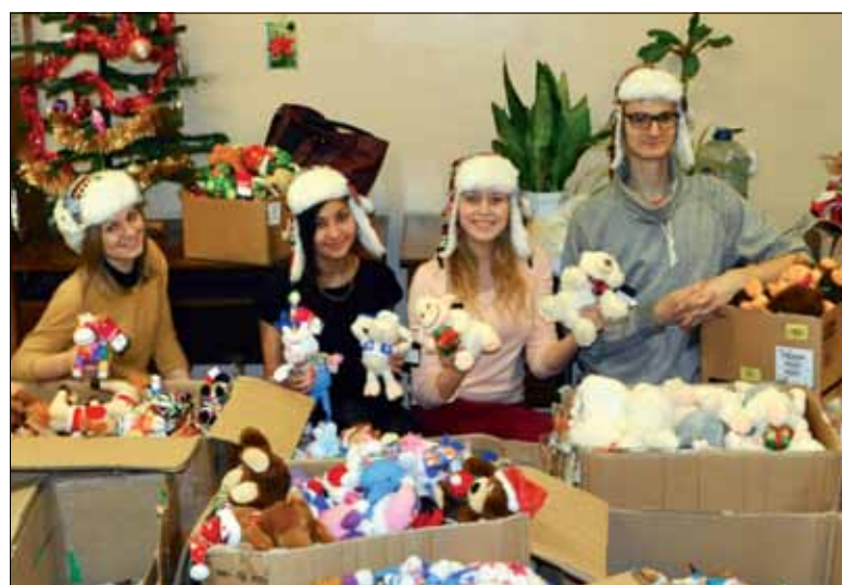
Я активно участвую в добровольческой деятельности (поездки в школу-интернат, городские и внутривузовские акции). На этом снимке мы с волонтерами упаковываем новогодние подарки для детишек из школы-интерната № 28 Калининского района

Как я «расслабляю свой разум»? Занимаюсь йогой, читаю художественную литературу и путешествую – это здорово помогает «разгрузить» мозг. Тогда и сосредоточиться на чем-то серьезном уже гораздо легче.