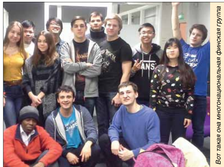
Вот такая она многонациональная финская группа

В работе я рассмотрел виды биогазовых станций, типы топлива для них, химический про-