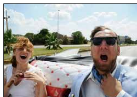
Что может быть символичнее свадьбы на Острове свободы

В наше время уже никто не представляет ученого эталом «сухарем», погруженным только в науку. Я, как и многие коллеги, люблю спорт: бег, йогу, пилатес, они мне позволяют расслабиться после напряженных будней. А еще обожаю путешествия, причем, в различной «упаковке» – и как отдых, и как бизнес-поездки (конференции, семинары). Это отличная подзарядка для продолжения работы.