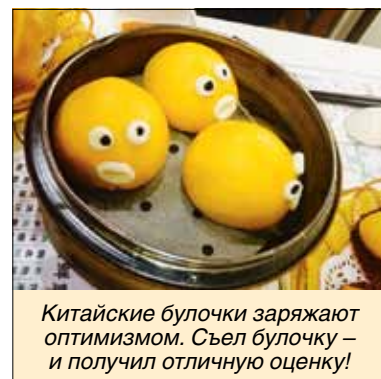
Китайские булочки заряжают оптимизмом. Съел булочку – и получил отличную оценку!

Тем политехникам, кто планирует учиться в КНР, могу дать несколько советов. Прежде все-