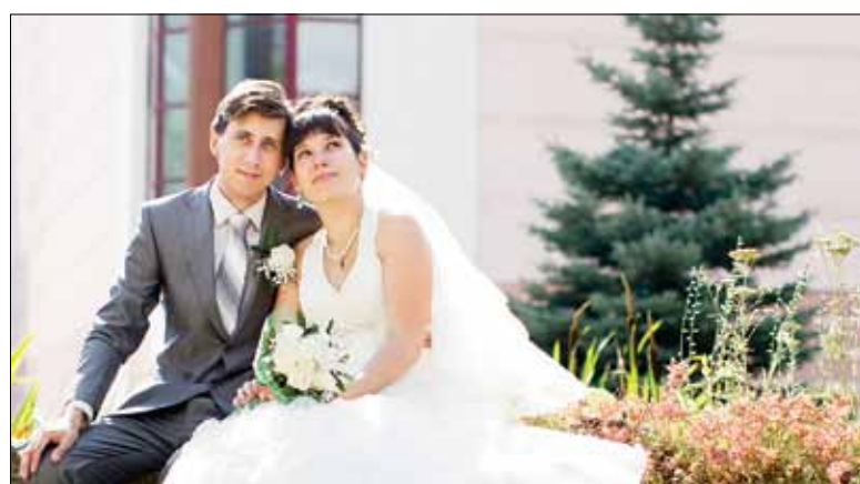
Самым памятным событием в моей жизни, и не только студенческой, была свадьба. Правда, я ее помню смутно, так как очень волновалась

А вот кто «умный и талантливый» среди школьников мы, жюри, узнаем на городских олимпиадах по физике. Готовим для них вопросы, проверяем решение задач, проводим апелляции. Конечно, это тоже отнимает много времени, которого и так-то нет. Но зато как увлекательно! С ребятами не соскучишься: то они по теме веселые картинки составят, то стихи сочинят.