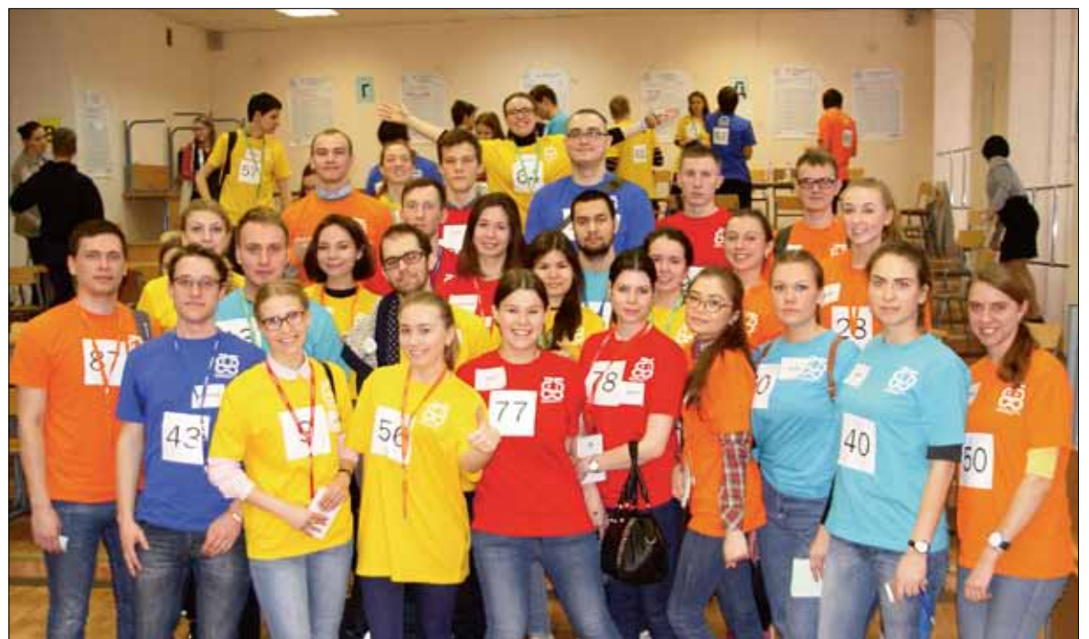
Наши звезды: полпреды студенческой элиты Политеха. И это только малая их часть!