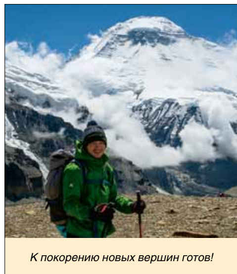
К покорению новых вершин готов!