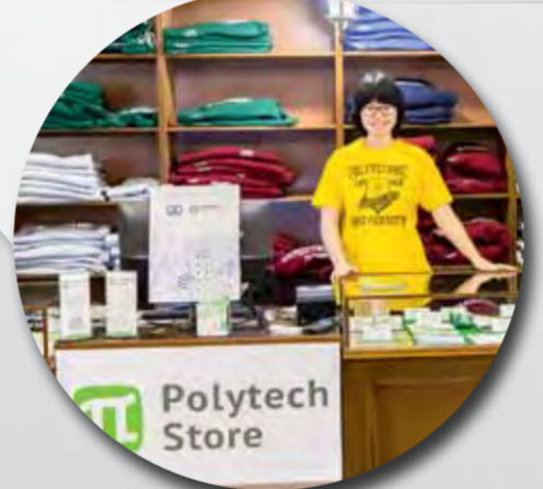
Магазин фирменных товаров Polytech store