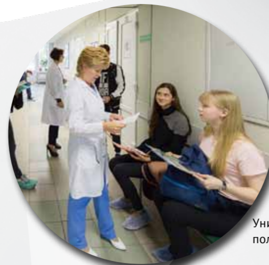
Университетская поликлиника №76

ПОЛИТЕХ Санкт-Петербургский политехнический университет Петра Великого