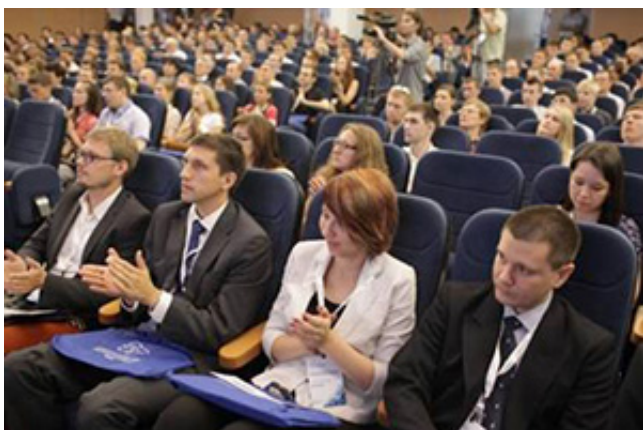
Конференция молодых ученых «ЭНЕРГИЯ ЕДИНОЙ СЕТИ»

Краткий обзор по итогам конференции доступен на сайте ОАО «НТЦ ФСК ЕЭС» - http://www.ntc-power.ru/yscl/ .