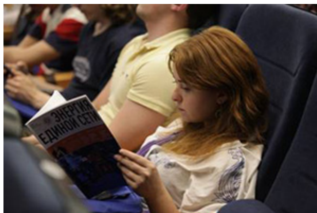
Конференция молодых ученых «ЭНЕРГИЯ ЕДИНОЙ СЕТИ»