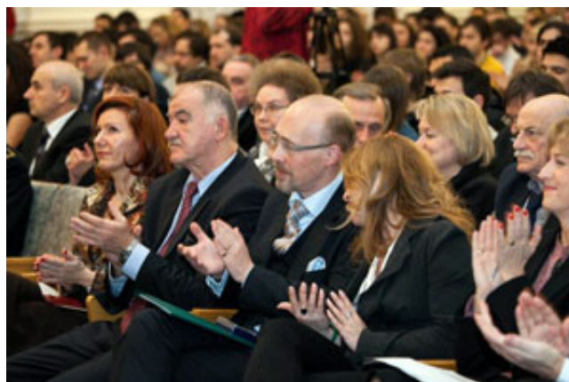
Открытие Недели науки