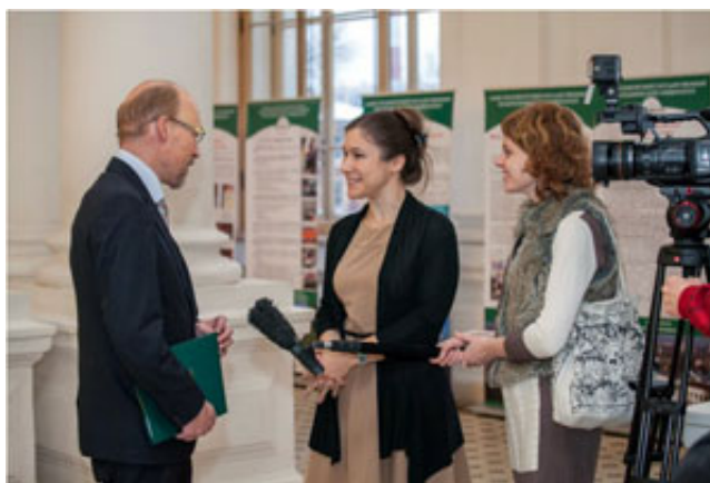
Интервью Филиппа Нобеля