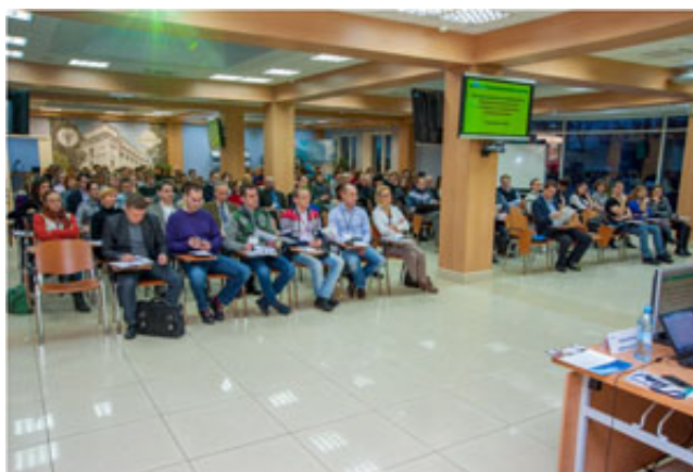
Конференция по управлению проектами в Ресурсном центре