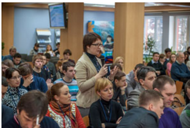
Участники конференции в Ресурсном центре