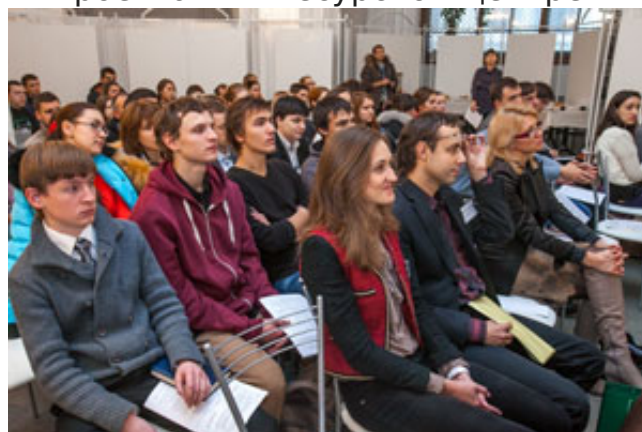
Семинар в Экспоцентре