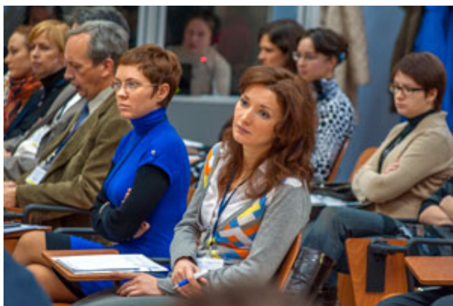
Студенты на Неделе науки