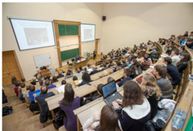
Лекция Патрисии Грэм на Неделе науки в СПбГПУ