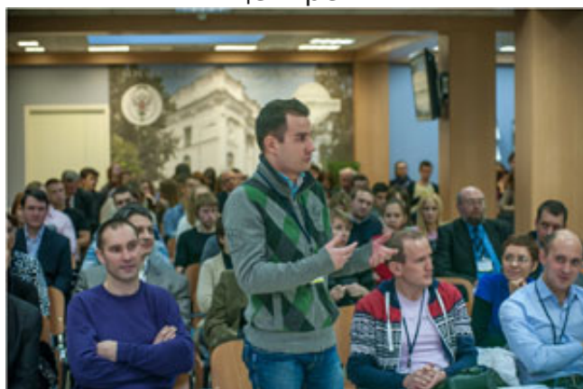
Вопросы докладчикам конференции