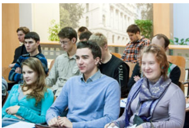
Студенты на Неделе науки