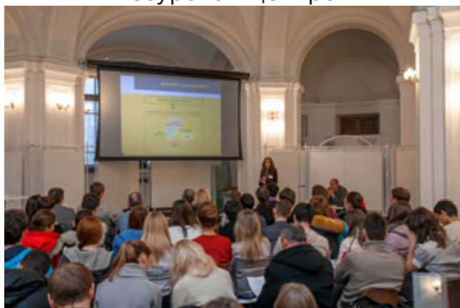
Семинар в Экспоцентре СПбГПУ_4 декабря