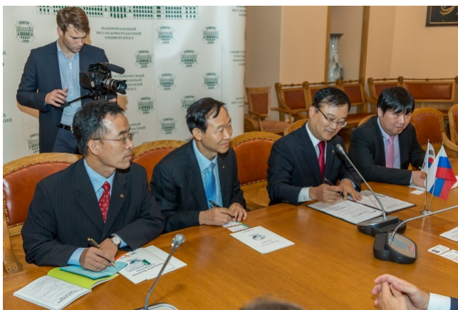
Представители Республики Корея