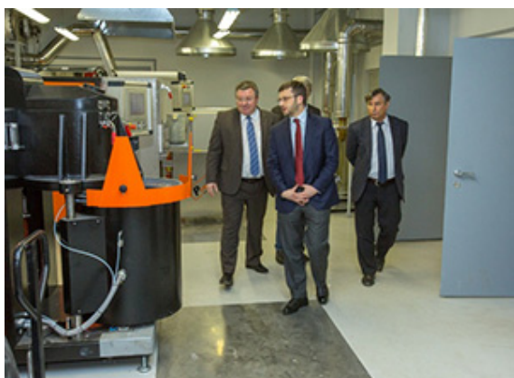
Зам.министра в НТК МашТех

В ближайшие годы конкуренция за вас будет только расти. За выпускников ведущих вузов, получивших опыт в таких лабораториях, как есть в Санкт-Петербургском Политехе, будут драться работодатели – и вузы, и НИИ, и производственные компании. У вас замечательное будущее! Нужно только работать и делать свое дело. Удачи!».