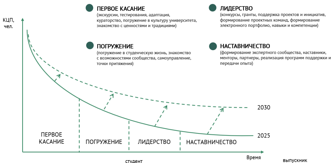
Рис. 3. Жизненный цикл работы с молодежью в СПбПУ.

Для реализации комплексных направлений воспитательной деятельности и реализации молодежной политики в СПбПУ смоделирован жизненный цикл работы с молодежью (Рис. 3), в рамках которого до 2030 планируется повысить вовлеченность обучающихся в ключевые процессы работы с молодежью :