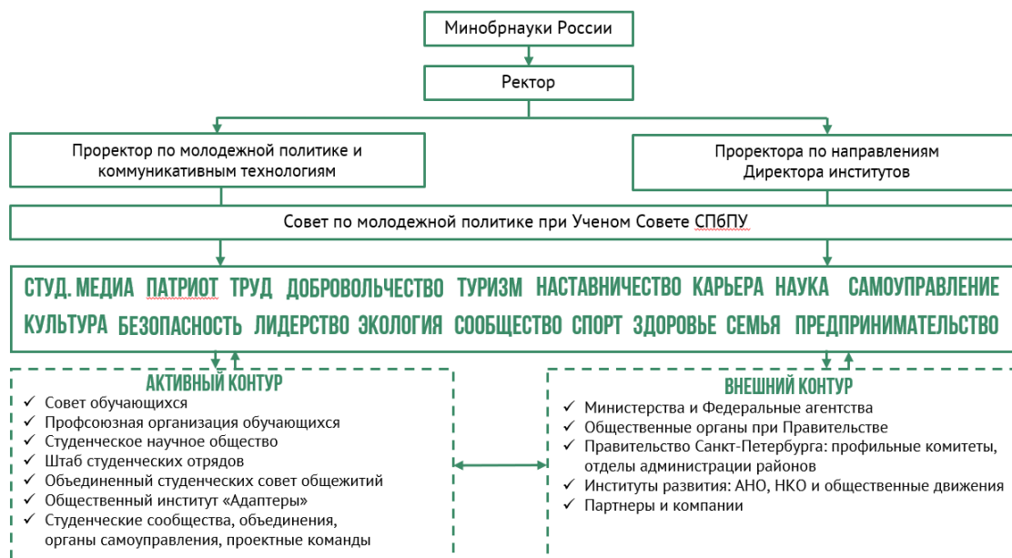
Рис. 4. Структура координации воспитательного процесса и реализации молодежной политики в СПбПУ.

Основные функции управления воспитательным процессом и реализацией молодежной политики в рамках СПбПУ принадлежат Совету по молодежной политике при Ученом Совете СПбПУ (Рис. 4).