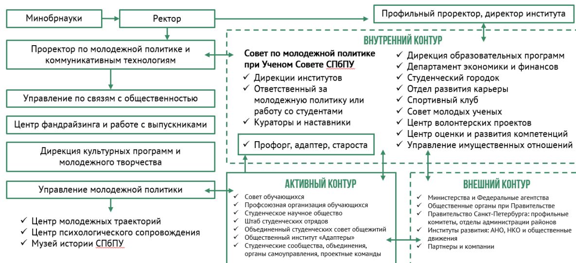
Рис. 5. Модель трех контуров координации воспитательного процесса и реализации молодежной политики в СПбПУ.

воспитательные функции и назначается из числа преподавателей или учебно-вспомогательного персонала. Деятельность куратора определяется планом воспитательной работы. Административно куратор академической группы подчинен заместителю директора института по работе с молодежью и согласовывает свою деятельность с директором института и заведующими кафедрами и высших школ.