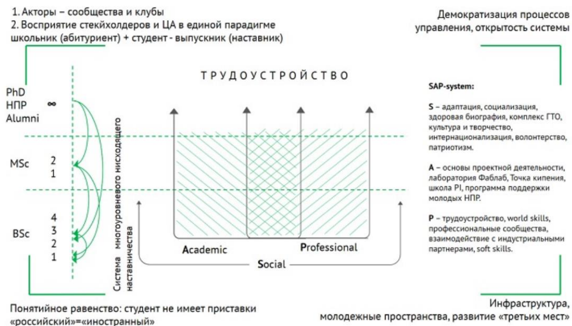
Рис. 2. Целевая модель воспитательной деятельности и реализации молодежной политики СПбПУ.

Реализация программ воспитательной деятельности и молодежной политики в СПбПУ строится на поддержке и развитии трех систем поддержки обучающихся (Рис. 2):