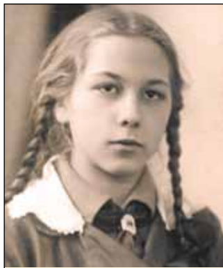
Фото довоенных лет