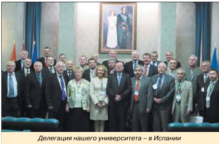
Делегация нашего университета – в Испании

Деловая программа визита была насыщенной. Члены делегации приняли активное участие в конференции на тему «Совре-