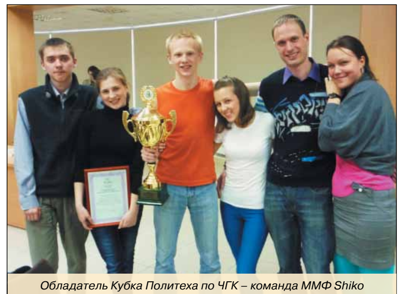
Обладатель Кубка Политеха по ЧГК – команда ММФ Shiko

Учредитель газеты: НИУ «Санкт-Петербургский государственный политехнический университет» Газета зарегистрирована исполкомом Ленинградского горсовета народных депутатов 21.01.91 г. № 000255