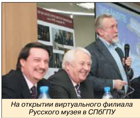
На открытии виртуального филиала Русского музея в СПбГПУ

Полный текст интервью можно прочитать на сайте кафедры www.itd.imop.spbstu.ru .