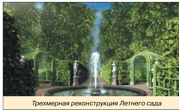
Трехмерная реконструкция Летнего сада