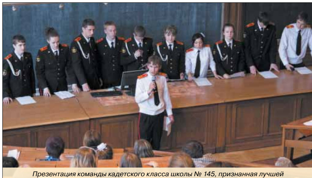
Презентация команды кадетского класса школы № 145, признанная лучшей