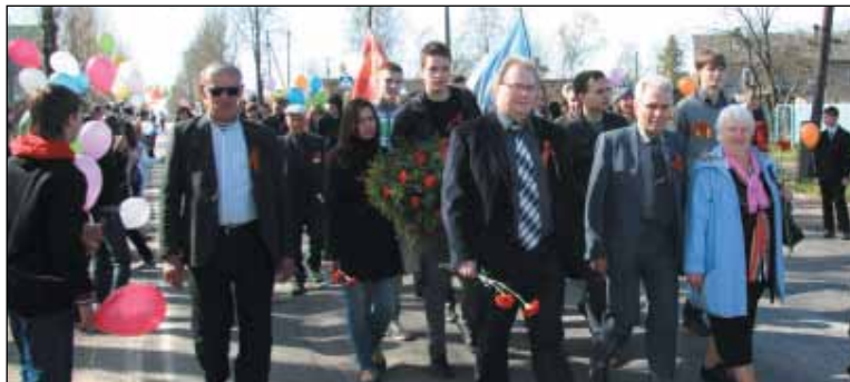
Делегация СПбГПУ в пос. Тайцы, где захоронены политехники, погибшие здесь в 1941 г.