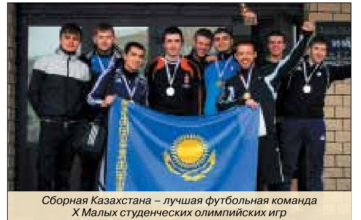
Сборная Казахстана – лучшая футбольная команда X Малых студенческих олимпийских игр