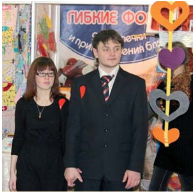
Студенческая свадьба

Традиционный флеш-моб от профбюро ФУИТ в этот раз стал танцем «поцелуя». Его исполнили в фойе Главного здания сразу 50 человек.