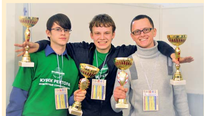
Члены команды Fantastic_4 – победители в категории Case Study

Студенческое инженерное общество благодарит всех участников соревнований 2012 г. «Вы не перестаете радовать нас своими идеями и вдохновлять на новые проекты! Желаем всем, кому еще не достался заветный кубок, не отчаиваться, а ждать Инженерных соревнований в новом учебном году!»