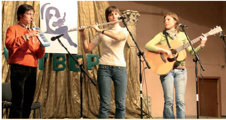
Скоро фестиваль исполнителей авторской песни «Эхо-2012». Следите за афишей!