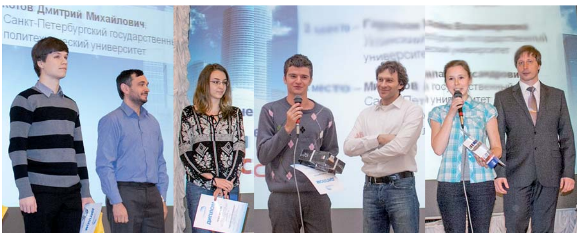
Награждение победителей и призеров конкурсов олимпиады

Состязания проходили 20 февраля в компьютерных классах Института государственного управления и информатизации СПбГПУ (11 уч. корпус). Конкурсными заданиями послужили реальные практические задачи, которые были разработаны при поддержке партнеров IT-Олимпиады – ведущих мировых производителей программного продукта и оборудования: Intel, Oracle,