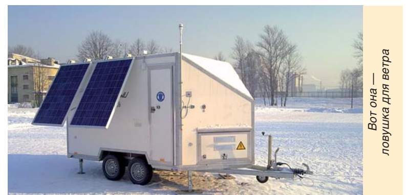
Вот она — ловушка для ветра