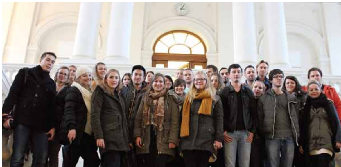
Российские студенты устроили для голландских студентов кампус-тур по Политеху