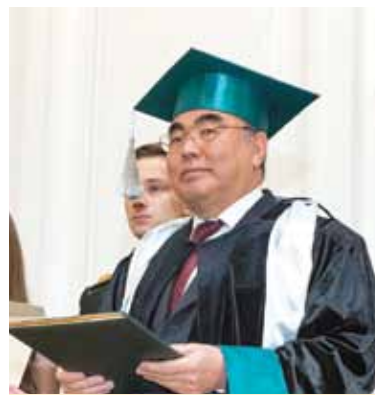
Профессор Аскар Акаевич Акаев

ти все эти ученые так или иначе были связаны с Ленинградским политехническим институтом.