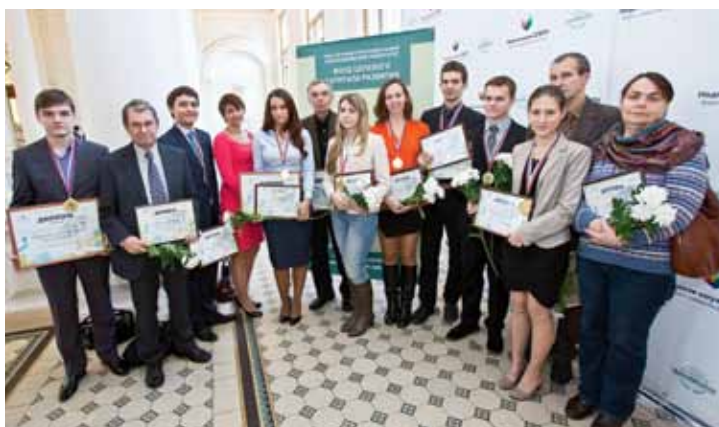
Победители, лауреаты конкурсов СПбПУ и их научные руководители