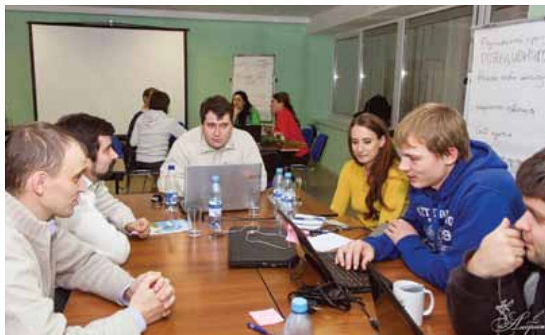
При подготовке материалов полосы использована информация Медиа-центра СПбПУ

– Для выполнения Программы очень важно вовлечь как можно большее число политехников разного уровня управления из разных подразделений. Очень радует, что эта сессия была инициирована самим Советом молодых ученых и специалистов. Она позволила услышать новые интересные идеи и проекты.