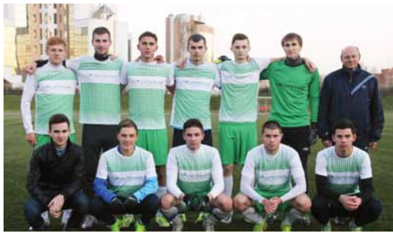
Верим, что в весеннем сезоне сборная СК «Политехник» снова взойдет на высшую ступень пьедестала.

Футбольная сборная «Политехник» достойно завершила осенний сезон, став бронзовым призером городского Первенства по футболу среди вузов в формате 11х11.