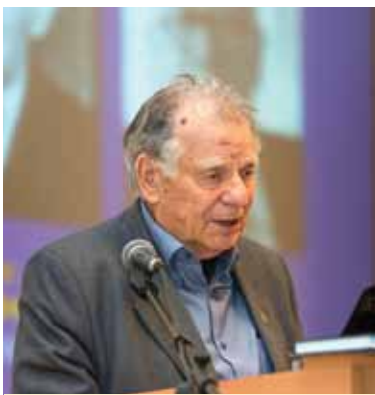
Нобелевский лауреат Жорес Иванович Алферов

Докладчик апеллировал к историческим фактам, анализировал тенденции и, конечно, упомянул имена выдающихся советских, российских и зарубежных ученых, каждый из которых в свое время был «инженером нового типа». Виталий Гинзбург и Юлий Харитон, Абрам Иоффе и Петр Капица, Николай Семенов и Игорь Курчатов, Анатолий Александров, Андрей Сахаров, Яков Зельдович и другие – все они были новаторами в физике. Одни из них стали авторами отечественного атомного проекта, другие открыли новые законы в физике, математике, химии, которые легли в основу промышленного развития страны. Примечательно, что поч-