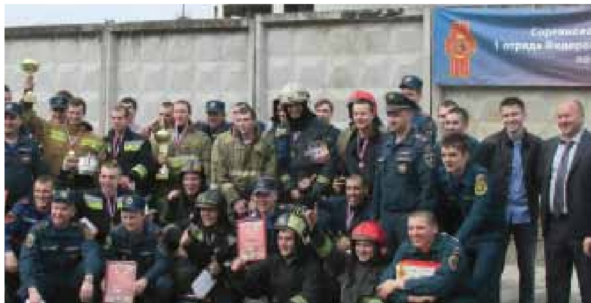
После церемонии награждения. Радость на всех одна: молодые гордятся своей победой, а профессионалы довольны, что выросла достойная смена