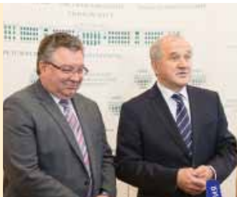
А.И. Рудской и В.И. Булавин

По приглашению ректора СПбПУ А.И. Рудского Политех посетил Полномочный представитель Президента РФ в СЗФО В.И. Булавин. Он ознакомился с разработками новых материалов и технологий, направленными на решение задач импортозамещения и импортоопережения в российской промышленности.