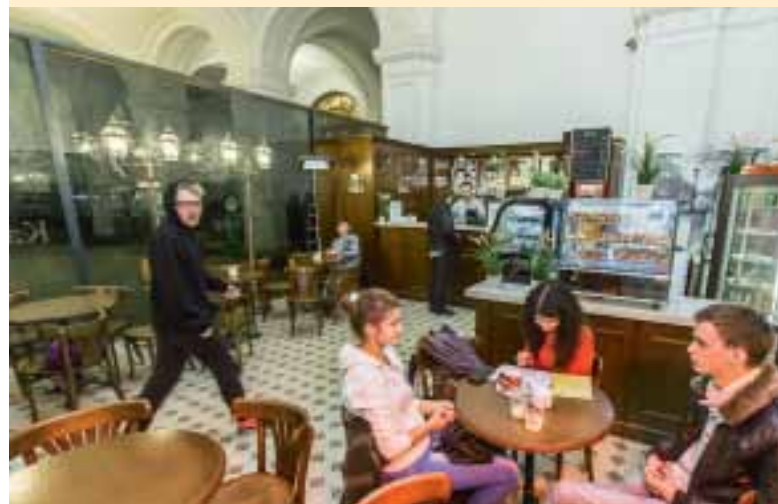
«Бульвар» в Главном здании