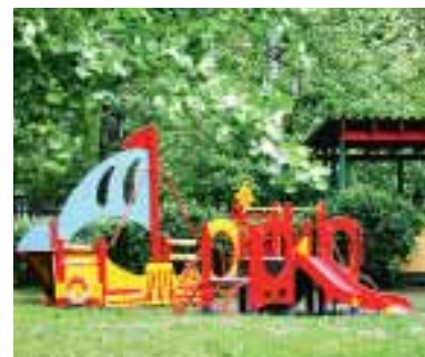
В детском саду, расположенном на территории вуза, всегда рады сыновьям и дочкам студентов-политехников

Ваши отзывы и идеи присылайте на электронный адрес zhukova@spbstu.ru.