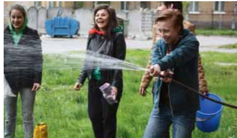
Эко-акция на площадке «Лесная»

Все было как раньше: каждому участнику акции повязали пионерский галстук, и под лозунгом «Мир. Труд. Май» ребята, окунувшись в атмосферу советского времени, устремились к трудовым подвигам. Прохожие поддерживали политехников улыбками, а некоторые даже присоединялись к работе. Когда все задания были выполнены, в Студклубе было организовано чаепитие и звучали песни под гитару.