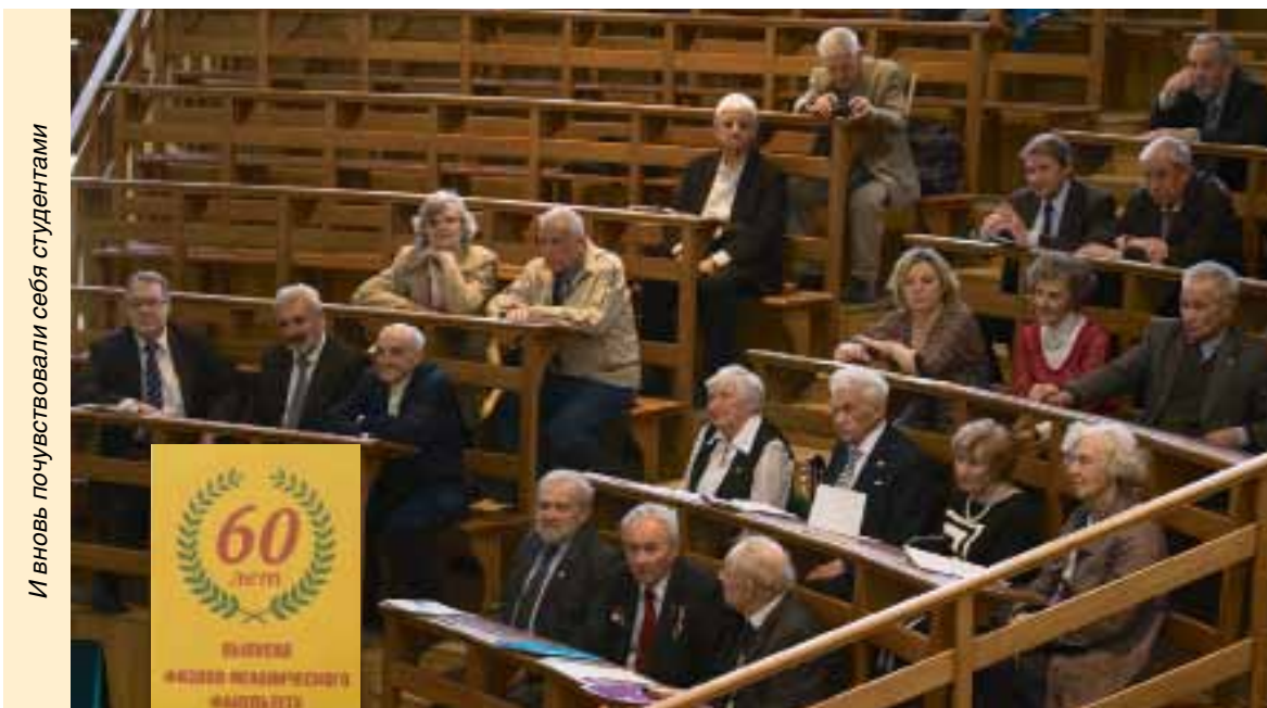
И вновь почувствовали себя студентами

Во время встречи состоялась презентация книги «Шестьдесят лет в строю». Каждый из авторов этого сборника в большей или меньшей степени был причастен к тем исключительно важным изобретениям и открытиям, которые предопределили дальнейшее развитие науки и техники не только в нашей стране, но и во всем мире.