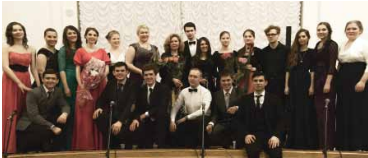
Студия академического и эстрадного вокала «PolyVox»

РАЗРЕШИТЕ ОТЧИТАТЬСЯ! – ДЕМОНСТРАЦИЯ ТАЛАНТОВ