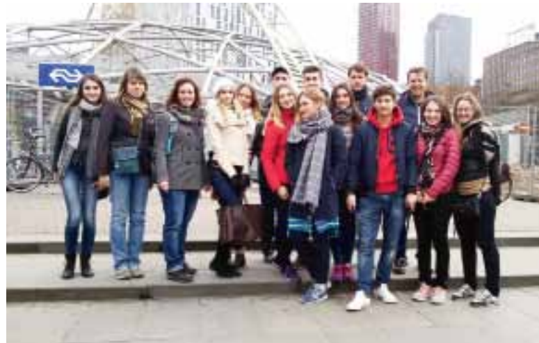
Студенты и преподаватели ИЗИ в Голландии

Во время встречи с научным директором Амстердамского института исследований бизнеса