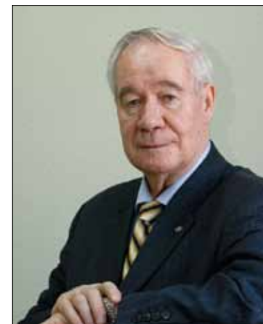
ном Российской академии естественных наук.