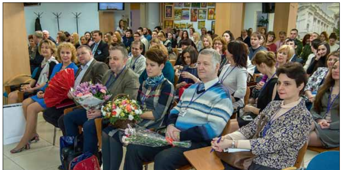
Преподаватели и сотрудники СПбПУ пришли поздравить своих коллег