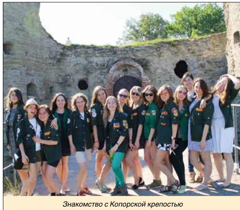
Знакомство с Копорской крепостью

Оставшаяся неделя пролетела как один миг. 28 августа мы трудились только полдня и с нетерпением ждали, когда выйдем за КПП и сможем с уверенностью сказать, что больше никогда сюда не вернемся. И это мгновение настало как-то неожиданно быстро.