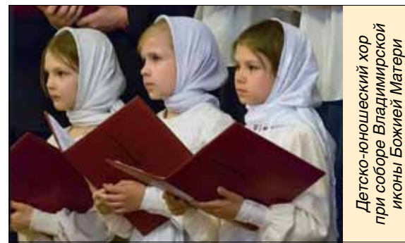
Детско-юношеский хор при соборе Владимирской иконы Божией Матери