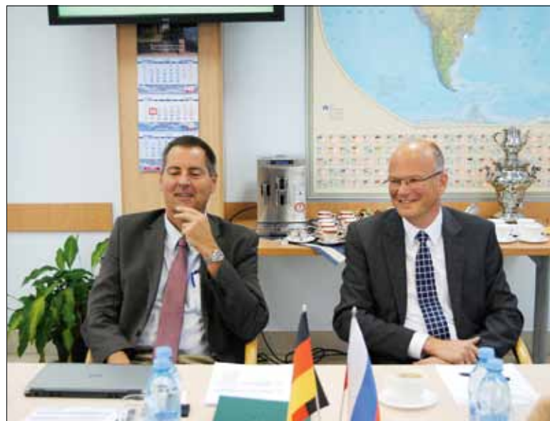
Представители ТУ Мюнхена на встрече в СПбПУ

Сотрудничество СПбПУ с компанией началось в 1995 г.