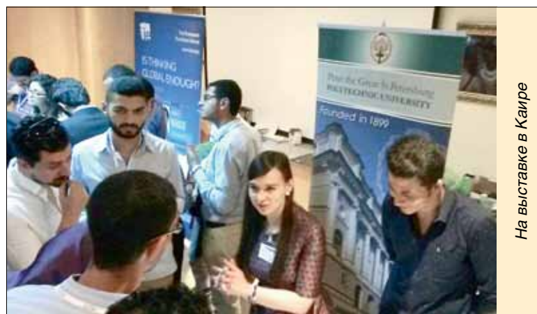
На выставке в Каире

В общем, наибольший интерес у посетителей вызвали междуна-