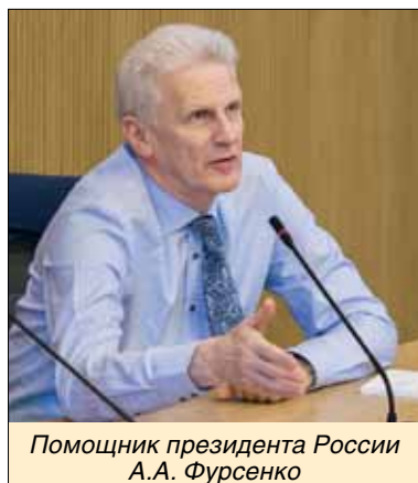
Помощник президента России А.А. Фурсенко

Стратегия научно-технологического развития будет осущест-