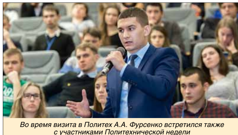
Во время визита в Политех А.А. Фурсенко встретился также с участниками Политехнической недели

вляться в четыре этапа. С 2016 по 2018 гг. – переход государственных научных организаций к новым организационно-правовым формам, внедрение системы оценки уровня готовности технологической и инновационной деятельности в Российской Федерации». Масштабное создание новых продуктов, товаров и услуг запланировано на 2019-2025 годы, а в следующие пять лет должен быть обеспечен «прорыв на глобальные рынки». К 2035 г. научно-технологическая система должна, согласно Стратегии, стабилизироваться и перейти к устойчивому саморазвитию.