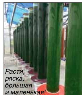
Растить, ряску, большая и маленькая!

Ученые СПбПУ предложили уникальный цикл переработки водорослей в ценные материалы и использование остаточной биомассы в качестве сорбентов для очистки воды с выработкой биогаза. На реализацию совместного с Технологическим университетом Гамбурга проекта выделено 3 года.