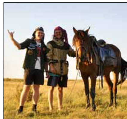
Вот и мы с конем по полю идем, вот и мы с конем по полю идем...