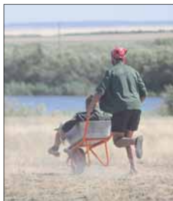
Навстречу новым трудовым свершениям?