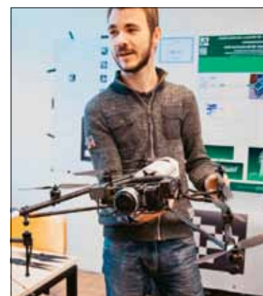
Магистранты ТУ Граца сделали дрон и используют его для съемки местности