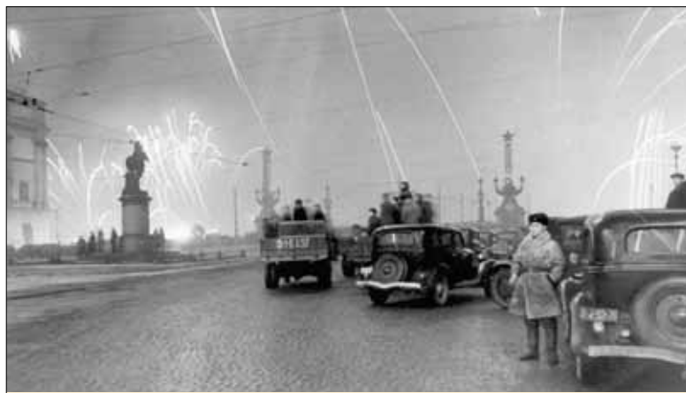
Праздничный салют 1944 г. в честь снятия блокады из 324 орудий