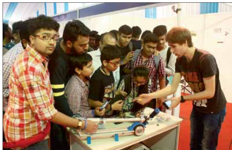
В Индии разработки политехников вызвали небывалый ажиотаж

С чем связаны ваши представления об Индии? Большинство ответит, конечно, с кинофильмами. А между тем эта страна является шестой космической державой в мире и сегодня самостоятельно запускает спутники связи, возвращаемые космические аппараты и автоматические межпланетные станции к Луне и Марсу. Поэтому вполне закономерно, что Международная выставка науки и технологий Techfest проходила на базе Института технологий Бомбея – ключевого вуза-партнера СПбПУ.