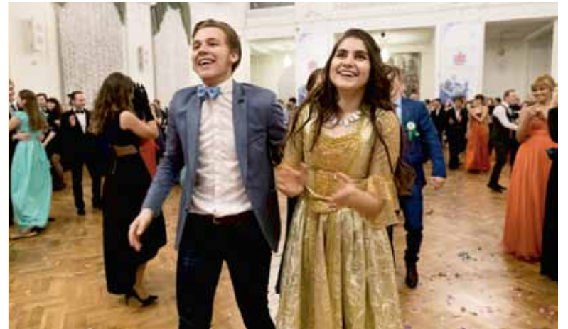
Студенчество – время, которое не ценим, торопимся жить. Как важно, узнаем не скоро мы, Студенческий дух сохранить.