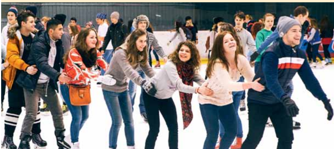
Праздник весело отметим: заслужили за труды!