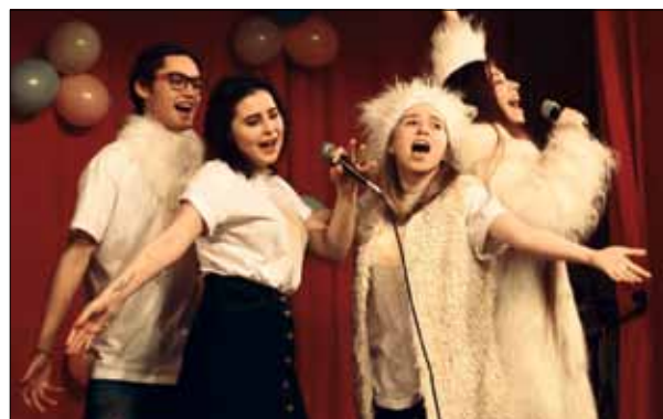
Зажигают White Bears

И все же главная особенность и прелесть «Радуги лингвистов» в том, что готовили ее сами студенты при поддержке Совета по культуре Политехнического университета и КПЦ «Гармония».