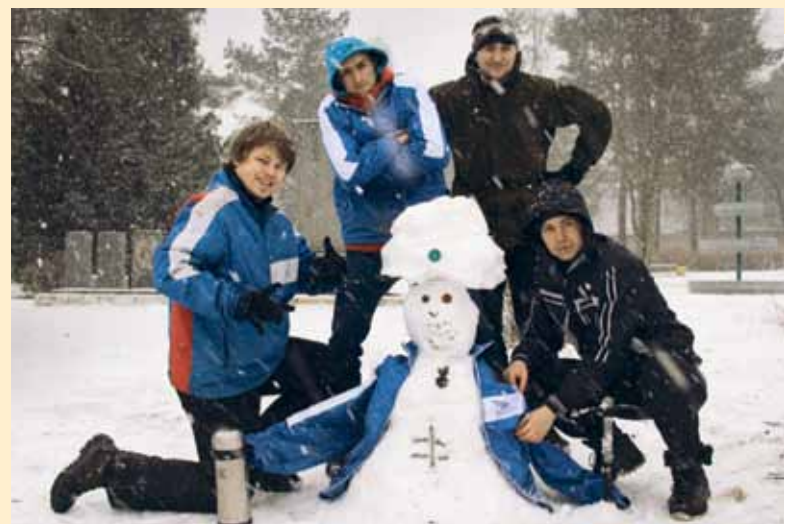
В Татьянин день – лепить не лень

Материалы страницы подготовила Ольга ЛЮДНИКОВА