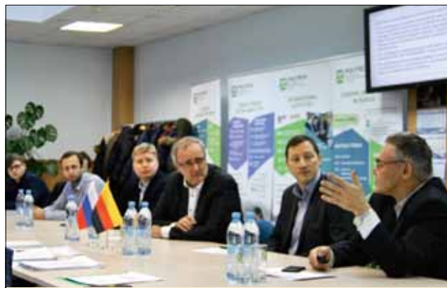
Жюри судит строго, но объективно

Компания Siemens – стратегический партнер СПбПУ с 1995 г. За всю историю сотрудничества реализовано более 20 крупных совместных НИР по различным направлениям, пять из них политехники выполнили в 2016 г. по заказу компании. SIEMENS – спонсор студенческих мероприятий и научных конференций, участник многих проектов, форумов и событий. Помимо запуска Стипендиальной программы, в этом году компания поддержала FabLab Polytech.