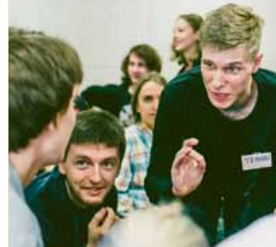
Студенты – особое общество: Свобода и планов размах, Фантазия, вольное творчество, В которых отсутствует страх.