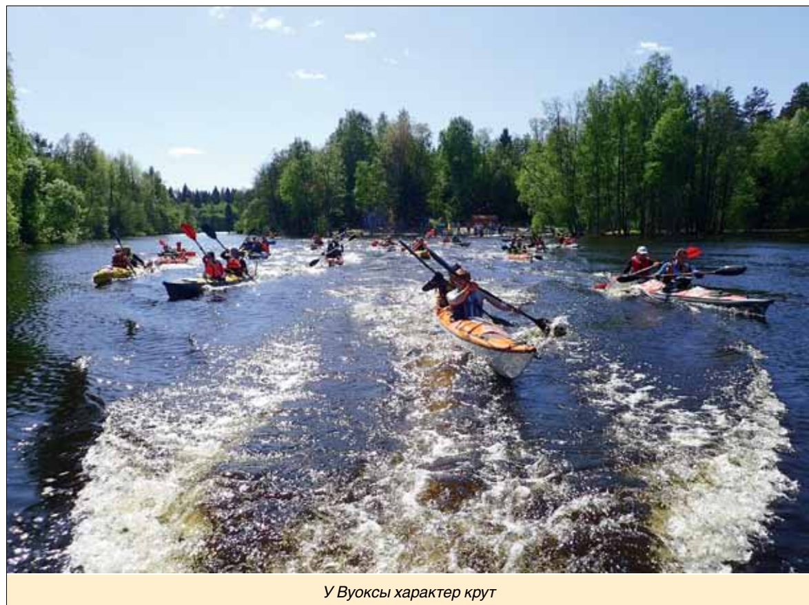
У Вуоксы характер крут