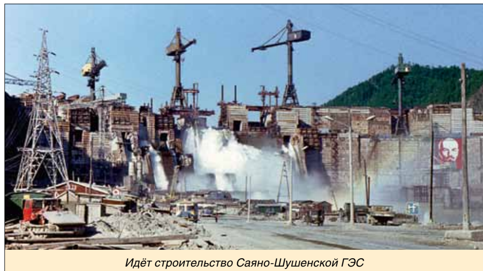
Идёт строительство Саяно-Шушенской ГЭС

– На Саяно-Шушенской ГЭС к нам в отряд определили парня, сказали, что он очень большая шпана из Выборгского района. В первый день он вёл себя независимо, огрызнулся, но на него вообще никто внимания не обращал. На следующий день его