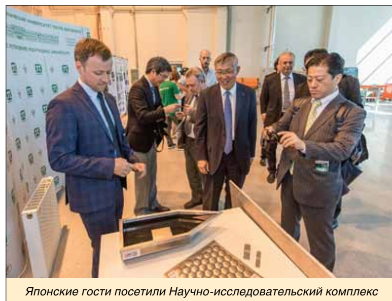
Японские гости посетили Научно-исследовательский комплекс

Глава корпорации считает перспективной совместную исследовательскую деятельность в этих