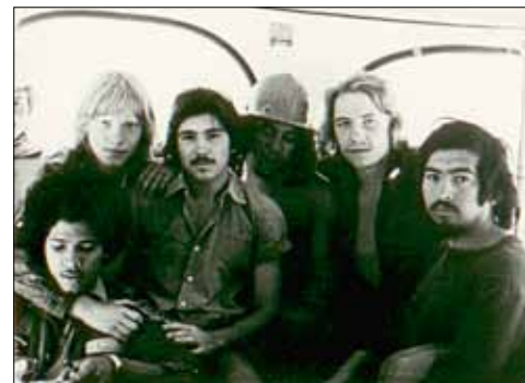
Стройотрядовская дружба – навсегда!

– В некоторых отрядах практиковалось обучение специальности бетонщика, каменщика ещё до отъезда. Конечно, класть кирпич – дело непростое, но всё же можно