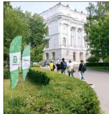
Все дороги ведут в Политех

ИЗДАНИЕ НАЦИОНАЛЬНОГО ИССЛЕДОВАТЕЛЬСКОГО УНИВЕРСИТЕТА «САНКТ-ПЕТЕРБУРГСКИЙ ПОЛИТЕХНИЧЕСКИЙ УНИВЕРСИТЕТ ПЕТРА ВЕЛИКОГО»