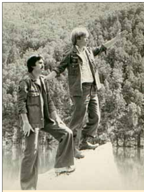
Мы навсегда сохраним в сердце своём Домбай

– Ездили, конечно, не все. Из нашей группы в 25 человек только пятеро участвовали в стройотрядовском движении. Многие ехали, потому что материальное положение не позволяло им жить безбедно целый год – просто зарабатывали деньги. А мне было ещё интересно увидеть страну, испытать себя, быть в коллективе. Друзья, которых я встретил в стройотрядах, это особые люди. С кем ты рос в одном дворе, с кем учился в школе, в университете, с кем работаешь – у каждой дружбы есть свой особенный вкус. Но стройотрядовская дружба – это отдельная история. Ты за два месяца очень хорошо узнаёшь людей, кто чего стоит. Мне повезло с ребятами, с которыми мы работали, это были настоящие бойцы, настоящие мужчины. Мы до сих пор поддерживаем самые тесные отношения.