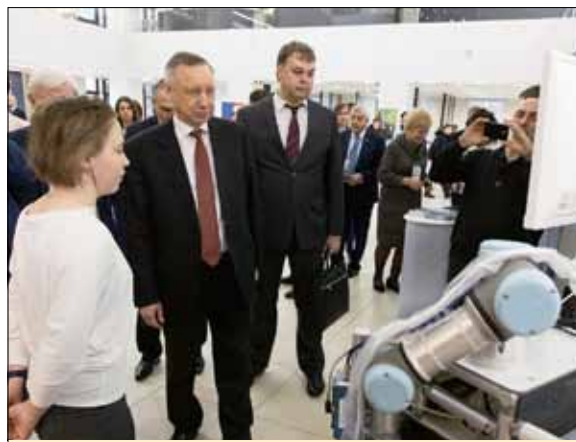
А.Д. Беглову продемонстрировали диагностический терапевтический комплекс, созданный на кафедре «Медицинская ультразвуковая аппаратура»

В частности, он говорил о возвращении научно- и академического образования в вузы, коснулся вопроса профессиональной карьеры молодых ученых в российских исследовательских инсти-