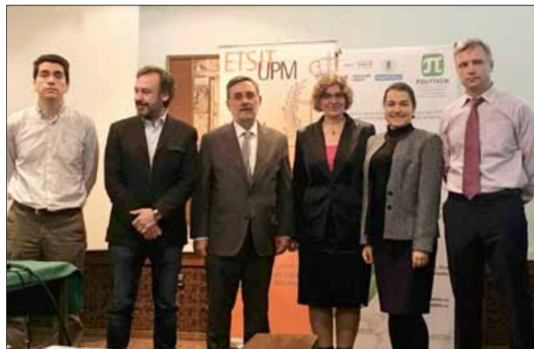
Представители МПУ, СПбПУ и Посольства РФ в Испании на церемонии открытия фестиваля Polytech: Science, Technology and Creativity