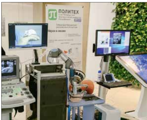
Выставка инновационных разработок Политехнического университета