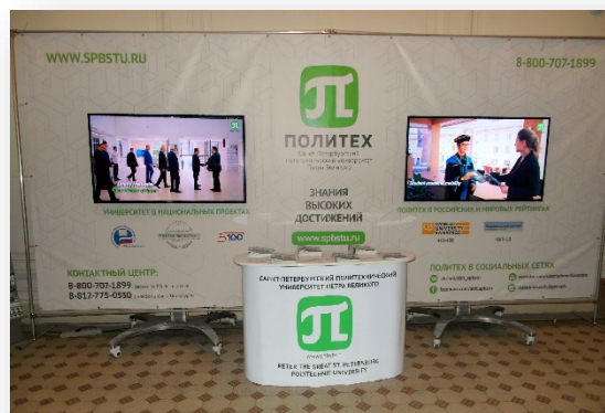
В помещении Информационного центра