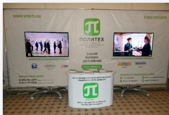
В помещении Информационного центра