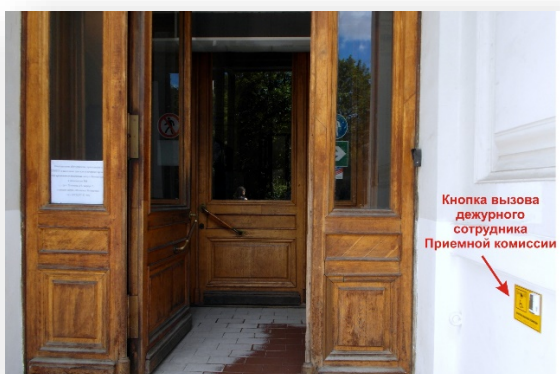
Вход в Главный учебный корпус

11. Приемная комиссия СПбПУ в период летней приемной кампании работает и ведет прием документов от поступающих в университет в Главном учебном корпусе (ГУК) . Для беспрепятственного доступа абитуриентов с ограниченными возможностями здоровья, имеющих нарушения опорно-двигательного аппарата, инвалидов-колясочников на стене справа от входа в ГУК размещена кнопка вызова дежурных сотрудников приемной комиссии. Волонтеры из приемной комиссии окажут помощь малоподвижной категории абитуриентов с нарушения опорно-двигательного аппарата для проезда на коляске внутрь Главного учебного корпуса, в фойе которого располагается Информационный центр приемной комиссии. Ответственные сотрудники Приемной комиссии непосредственно в помещении Информационного центра на первом этаже ГУК окажут абитуриентам с ограниченными возможностями здоровья, имеющим нарушения опорно-двигательного аппарата, консультативную и иную помощь по оформлению и подаче документов в СПбПУ.