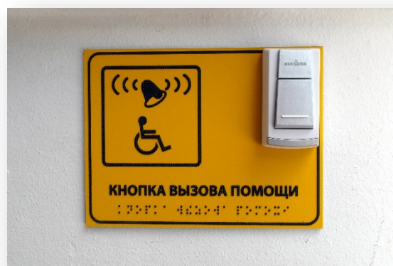
Кнопка вызова дежурного сотрудника Приемной комиссии