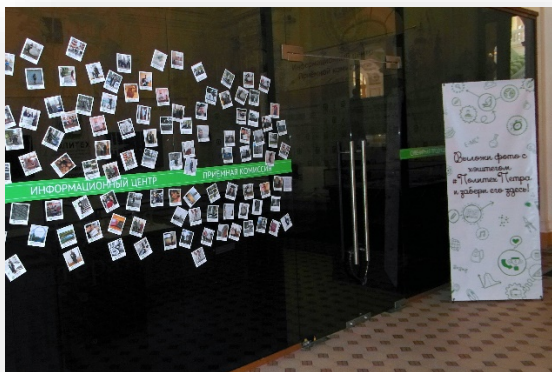
Информационный центр приемной комиссии