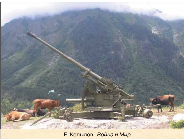
Е. Копылов Война и Мир